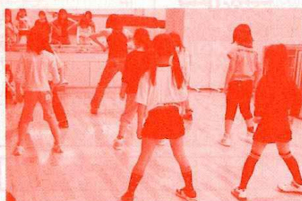
Kids Hip Hop