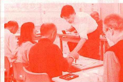
シニアのための英会話