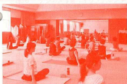
ピラティス & ヨガ