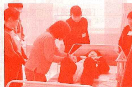
超わかりやすい 家庭でおこなう介護