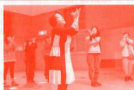
ハーティーコーラス