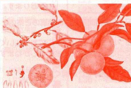
ボタニカルアート