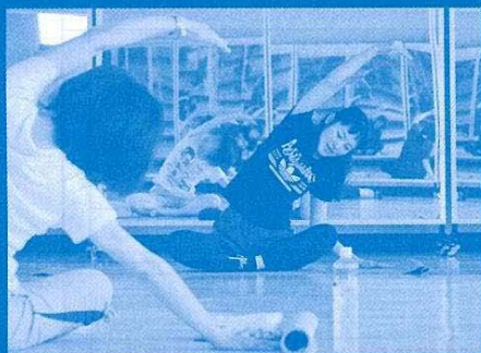
エアロピクスで楽しくリフレッシュ