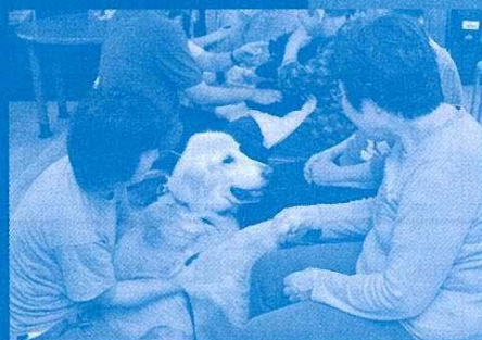
アニマルセラピー体験講座